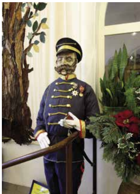
Práce klientky s ergoterapeutkou k 125. výročí založení Palaty.