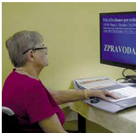
Často využívaná stolní nepřenosná lupa.

Nedílnou součástí péče je i psychologická podpora . Mezi hlavní aktivity patří individuální práce s klientem, skupinová terapie, krizová intervence či psychologické