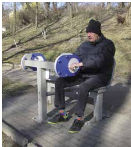
Cvičební stroje u laviček v parku.

křížovek, taneční terapie, ale také hipoterapie, někteří klienti měli možnost se poprvé v životě na koni také projet. Několikrát týdně je na všech čtyřech úsecích zařazen trénink paměti, canisterapie s asistenčními psy z Ligy vozíčkářů. Na třech úsecích jsou průběžně dovybavovány denní místnosti – kuchyňky a „obývák“, kde klienti mohou společně se zaměstnanci vařit oblíbená jídla jejich mláďí, poslouchat hudbu, dát si společně odpolední kávu nebo si zazpívat. V toce 2018 byly založeny dva nové kluby, pro ženy Kosmetický klub a pro muže Pánský klub, který je veden psychologem Domova. Pro klienty, kterým zdravotní stav nedovoluje účast na těchto akcích, jsou připraveny aktivity přímo u lůžka, čtení s pracovníky či dobrovolníky, luštění křížovek, poslech audio knih a další.