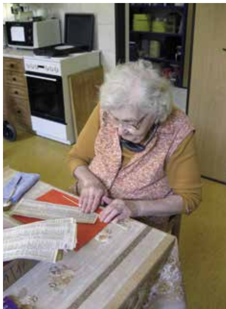
Úterní ruční práce.

Pro využití volného času klientů Domov pořádá koncerty, přednášky a divadelní představení, již tradiční pravidelnou úterní kavárnu s hudbou ve velké kulturní místnosti. Páteční mše je samozřejmostí a zájemci mohou navštěvovat i nedělní křesťanský zaměřenou četbu. Za teplého počasí se pravidelně každý měsíc pořádá grilování v zahradě Domova, chodí se na procházky do zahrady, kde jsou k dispozici klientům speciální cvičební stroje, umístěné přímo u laviček. Program akcí je sestavován vždy týden dopředu a ještě jsou klienti upozorňováni každé ráno rozhlasem na čas a místo pořádaných terapií. Mezi oblíbené patří i muzikoterapie, luštění