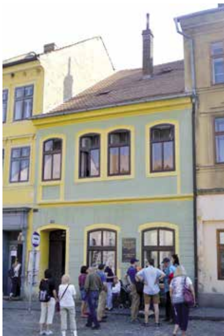
Výlet na Státní zámek Ploskovice a do města Ústěku k rodnému domu Aloise Klára.