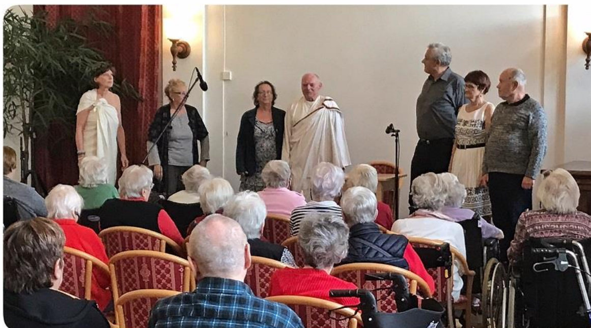
Vydává Palata - Domov pro zrakově postižené, jehož zřizovatelem je hl.m.Praha