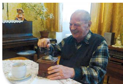
Pokoje s reminiscenčními prvky