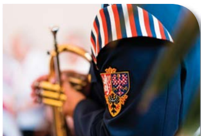
Koncert hudby Hradní stráže

v roce 2015 měli možnost mimo Domov navštívit 5 divadelních představení, 2 koncerty, zúčastnit se 3 celodenních výletů včetně oblíbeného výletu parníkem po Vltavě, 3x jsme zašli na procházku Prahou a v prosinci jsme si užili atmosféru Vánočních trhů na Staroměstském náměstí. V Domově jsme uspořádali úctyhodných 96 koncertů různých žánrů, 16 besed a přednášek s různými tématy, 8 pořadů s poezií, 7 divadelních představení a 4x jsme ochutnali buřtíky při grilování na zahradě. V dubnu se uskutečnil již 3. ročník akce „Když Palata tančí“, které se s tanečním vystoupením zúčastňují naši klienti, dále jako každoroční hosté žáci z různých škol, klienti Pobytového, rehabilitačního a rekvalifikačního střediska pro nevidomé Dědina a tanečnice z Centra tance Praha. Již tradičně proběhl Den otevřených dveří spojený s koncertem Hradní stráže a vystoupením pěveckého sboru Sluníčko. Celkem bylo na kulturní a společenské potřeby, které se financují z darů, vynaloženo 228 125 Kč.