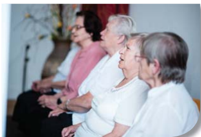
Pěvecký sbor Palaty „Sluníčko“