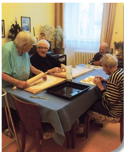
Klienti při pečení vánočního cukroví